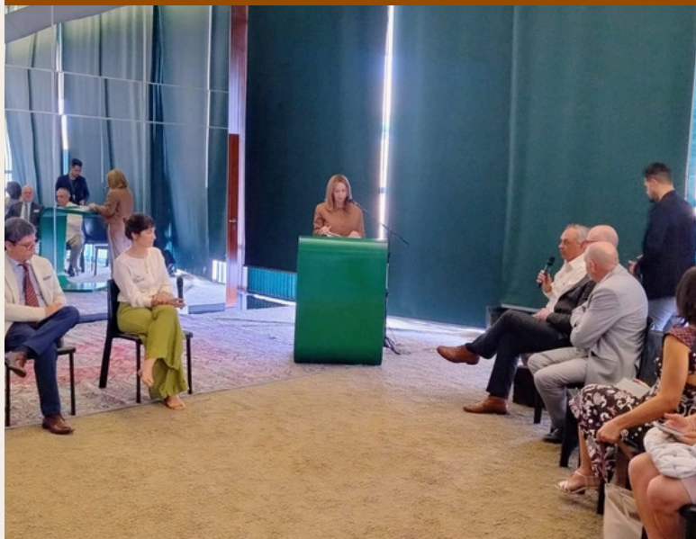
A Deputada Estadual do Acre, Socorro Neri discursa na Assembleia do Parlamento Amazônico.