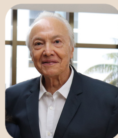
JOSÉ SEIXAS LOURENÇO PRESIDENTE PRO-TEMPORE DA UNAMAZ

As ações da UNAMAZ na COP30 integram um movimento mais amplo de revitalização da Associação, que busca consolidar redes de cooperação científica, ambiental e educacional entre as universidades amazônicas e seus parceiros internacionais, contribuindo para um futuro mais sustentável para toda a região.